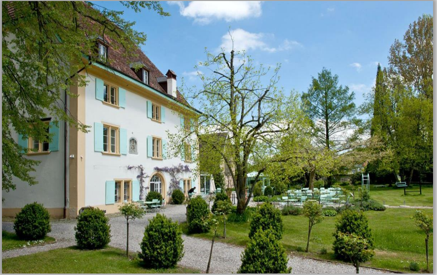
Schloss Ueberstorf tafeln, tagen, träumen