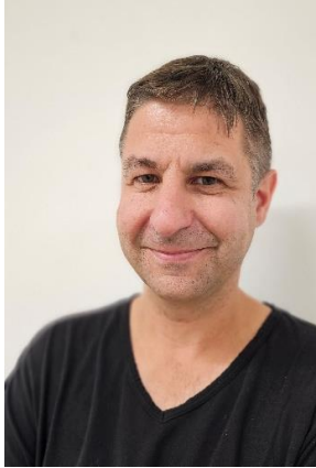
Roland Jutzi Regie-Assistenz