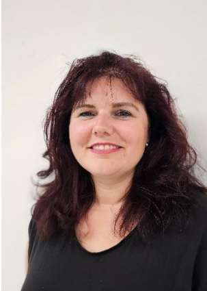
Carmen Boschung Regie