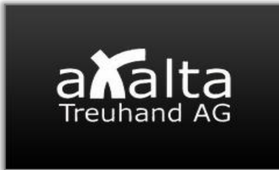
Axalta Treuhand, Ueberstorf